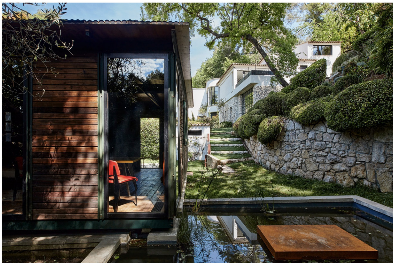
Vue sur la maison démontable de Jean Prouvé.