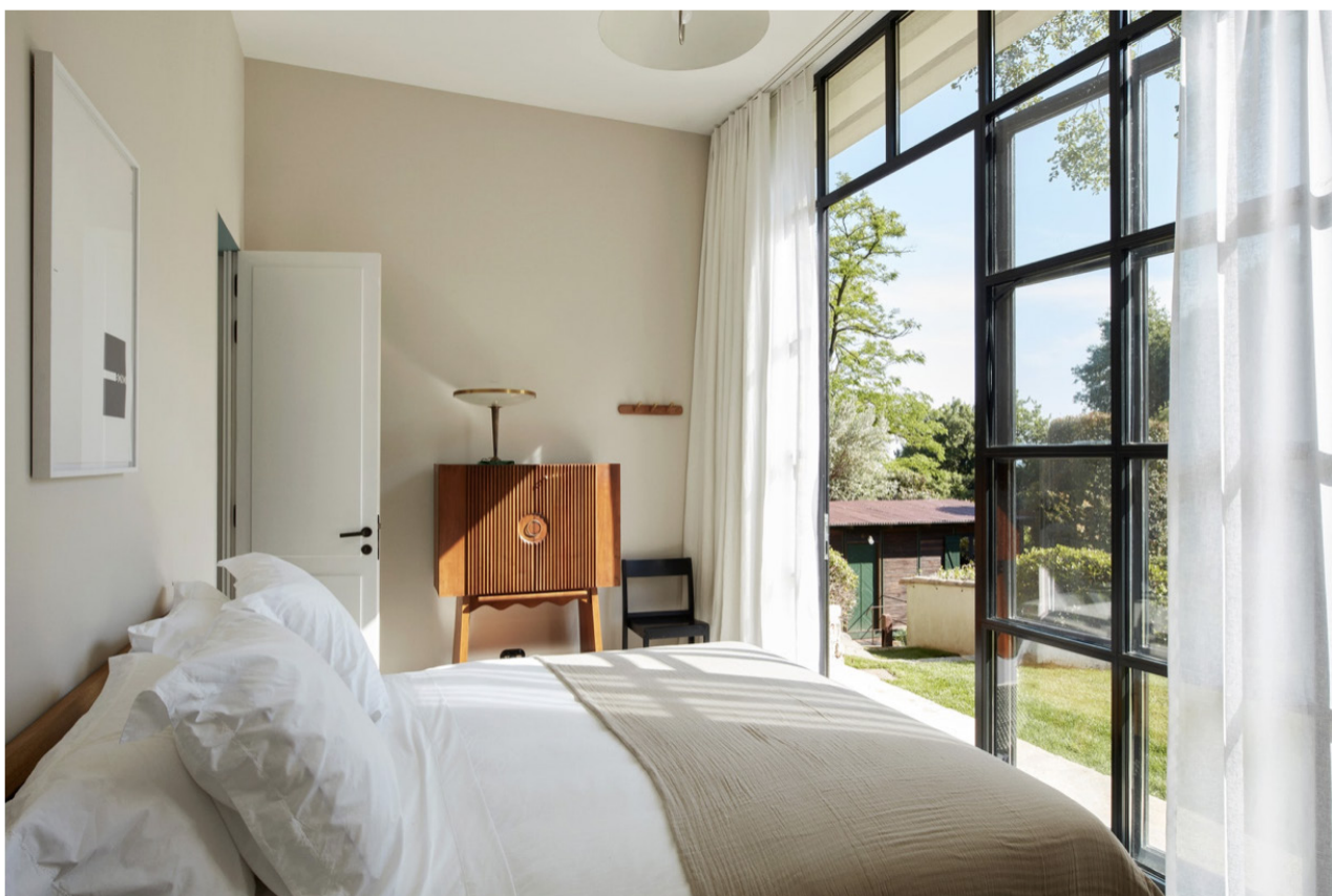
L'une des quatre chambres d'hôtes décorées avec du mobilier vintage.