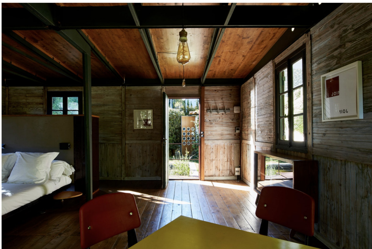
Cette maison démontable de Jean Prouvé a été adaptée en chambre avec son mobilier signé Prouvé.