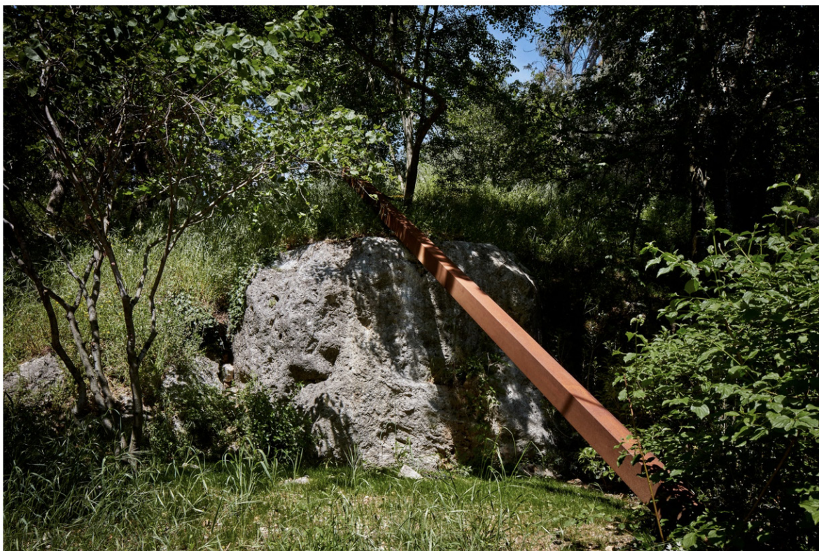
Bernar Venet, Ligne droite . © Antoine Lippens Antoine Lippens