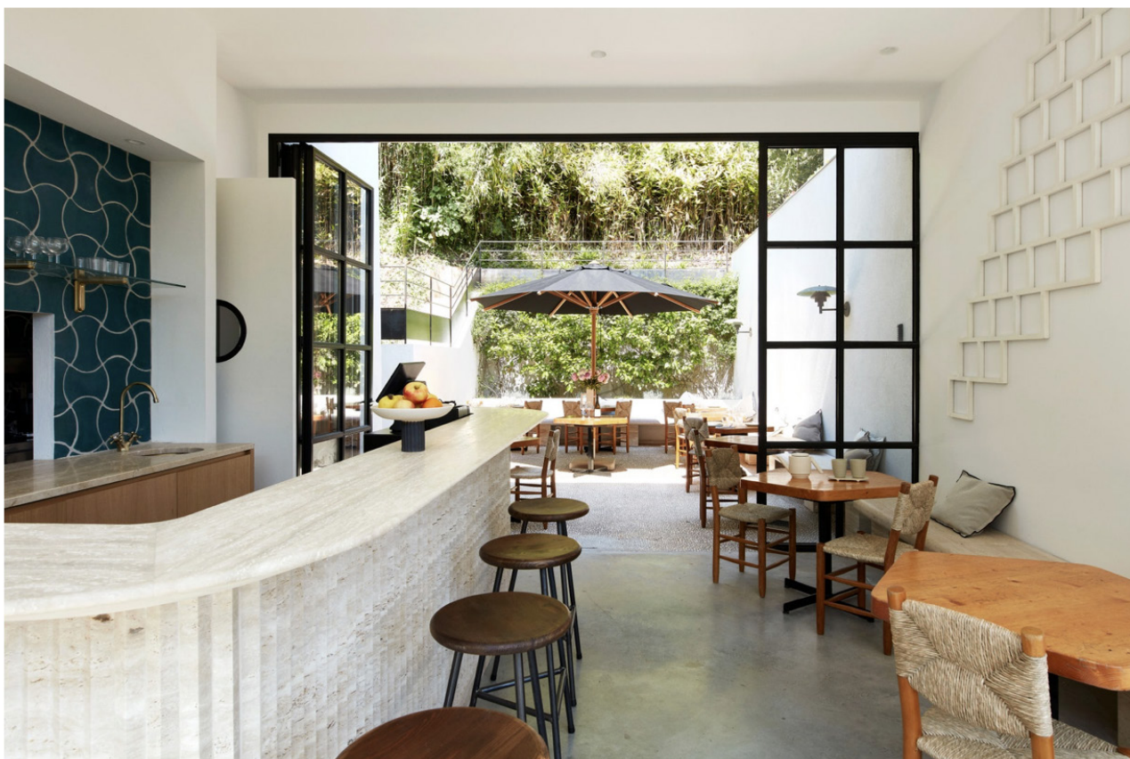
Aménagé par Charles Zana, le café-restaurant SOL où les tables vintage de Charlotte Perriand côtoient une sculpture murale de Sol LeWitt.